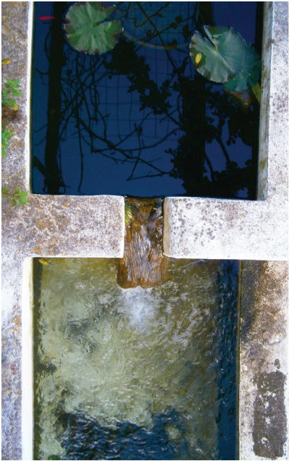
Autor: Ana Pereira

ULSNA+ UNIDADE LOCAL DE SAÚDE DO NORTE ALENTEJANO - EPE Mais Saúde e Qualidade de Vida. www.ulsna.min-saude.pt